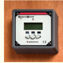
Befestigung mittels Halterung